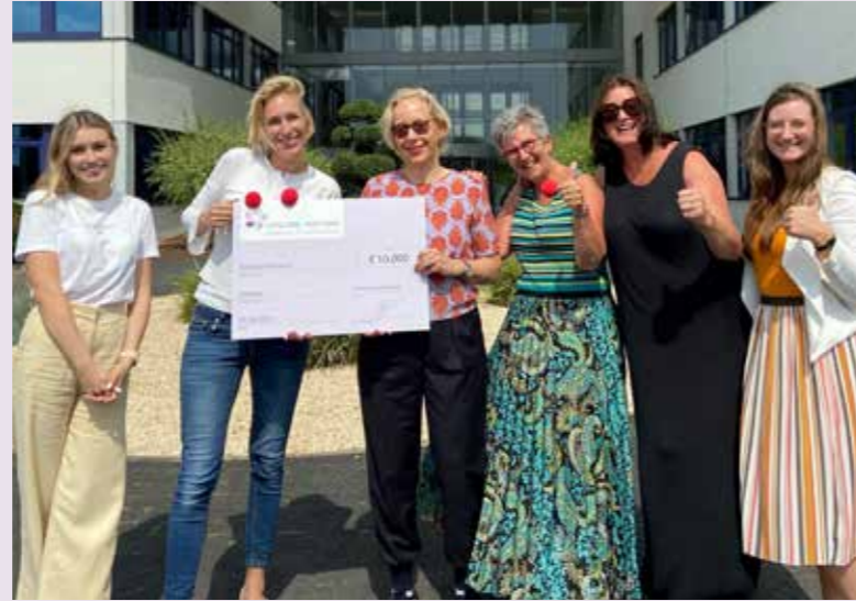
* Ungarn, Italien, Österreich, Frankreich, Bulgarien, Belgien, Ukraine, Schweiz, Tschechien und Niederlande

Hintergrund dieser Sonderausschüttung war eine Aktion, die der LR Global Kids Fund im ersten Halbjahr veranstaltete. In diesem Zeitraum wurden die Ländergesellschaften von LR dazu aufgerufen, nochmal neue Unterstützer für unseren Verein zu werben. Zehn Länder* nahmen diese Herausforderung mit großer Tatkraft an und erreichten eine stolze Anzahl neuer Fördermitglieder. Als Dankeschön für dieses Engagement flossen jeweils 10.000 € in die entsprechenden Kinderhilfsprojekte dieser Länder.